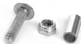
Schraube, Mutter und Abstandshülse