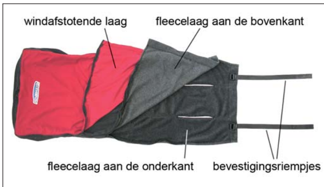
Chariot universele voetenzak

De Chariot universele voetenzak bestaat uit twee lagen. Bij warm weer kunt u de windafstotende laag weghalen door de ritssluiting te openen. Ook de bovenste fleecelaag is verwijderbaar, zodat als het warm is, alleen de onderste fleecelaag in het voertuig wordt gebruikt om erop te zitten.